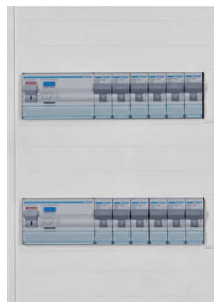
Abb. 3: FI-Schutzschalter mit sechs 1-poligen LS-Schaltern

Um beim Einsatz von FI-Schaltern die Verfügbarkeit hoch und das Risiko einer Überlast gering zu halten,