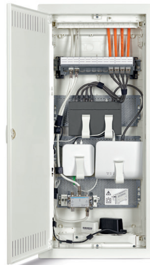
Abb. 1: Multimediateilverteiler

Zusätzlich zum Stromkreisverteiler ist in Wohnungen auch ein Kommunikationsverteiler (Abb. 1) vorzusehen. Dieser dient der Aufnahme von aktiven und passiven luK- und/oder RuK-Komponenten. Hierzu zählen beispielsweise TAE, Router/Modem, Switches, Verstärker, Spannungsversorgungen oder auch der optische Netzabschluss ONT. Der