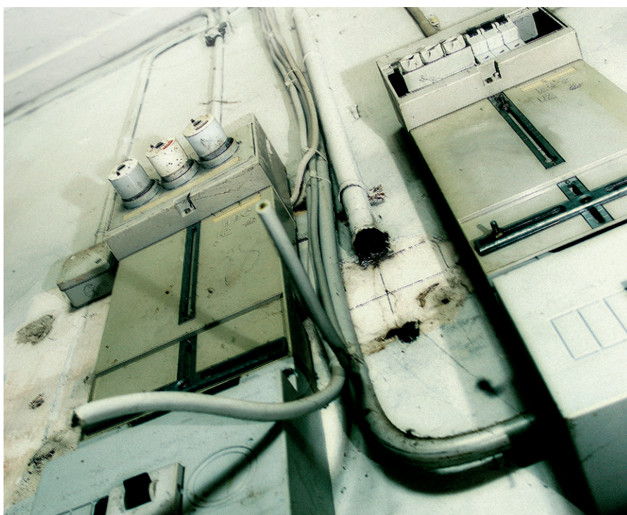
Gefahrenquelle veraltete Elektroanlage

Die dort beschriebenen Ausstattungswerte entsprechen den heutigen Komfort- und Sicherheitsbedürfnissen. Empfehlenswert wäre je nach Anforderung beispielsweise die Montage eines Installationskleinverteilers der volta Familie von Hager.