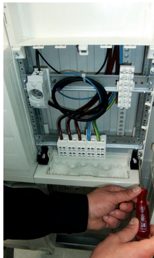
Zählerfeld oben und unten mit 2 x M5 anschrauben. Alle Schienen sind abzudecken!