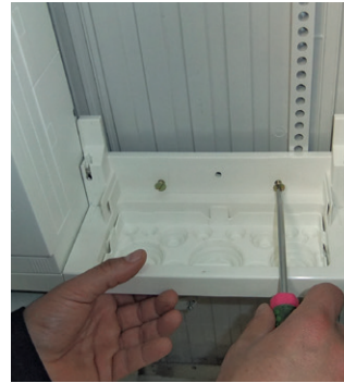
Stirnteil mit Membranflansch unten mit 2 x M6 anschrauben. Isolierkappen auf die Schrauben stecken.