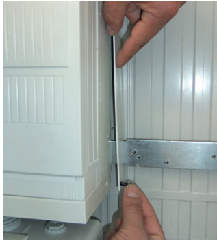
Rechten Isolierstreifen des Säulenfeldes abnehmen.