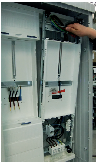
Zählerfeld in die Stirnteile oben und unten stecken.