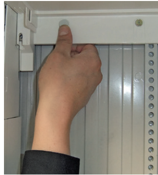
Geschlossenes Stirnteil oben mit 2 x M6 anschrauben.