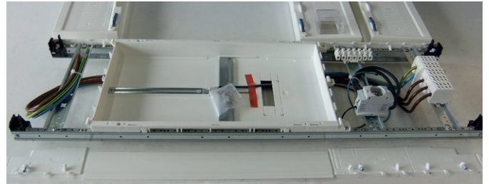
Linken Seitenstreifen des Einbaufeldes abnehmen.