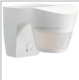
Außenbewegungsmelder 140° IP55, Aufbau, weiß