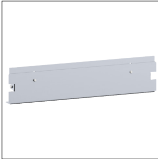
Endstück aus Stahl für Bodenkanal BKB/BKG 300x60