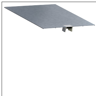
Oberteil mit Leitungsauslass für Bodenkanal geschlossen BKG500 mit 0,5m Länge