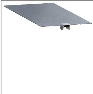
Oberteil mit Leitungsauslass für Bodenkanal geschlossen BKG500 mit 0,5m Länge