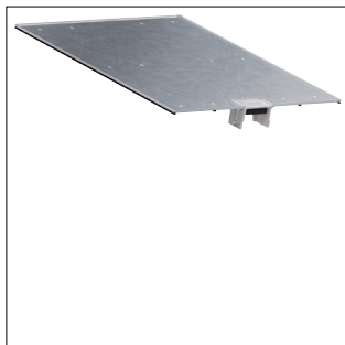
OT Wanne mit Leitungsauslass für Bodenkanal geschlossen BKG400 mit 0,5m Länge