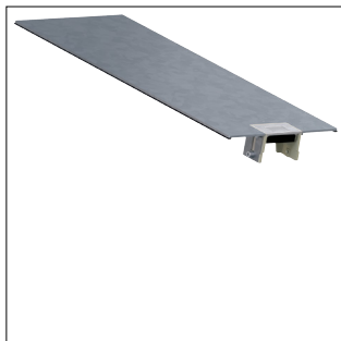
Oberteil mit Leitungsauslass für Bodenkanal geschlossen BKG200 mit 0,5m Länge