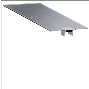
OT Wanne mit Leitungsauslass für Bodenkanal geschlossen BKG300 mit 0,5m Länge