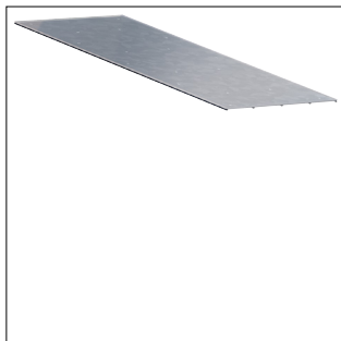
Oberteil Wanne für Bodenkanal geschlossen BKG400 mit 1m Länge