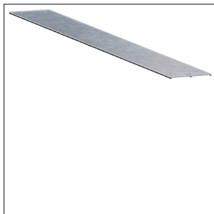
Oberteil Wanne für Bodenkanal geschlossen BKG200 mit 1m Länge