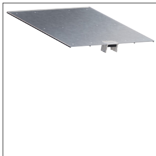
OT Wanne mit Leitungsauslass für Bodenkanal geschlossen BKG500 mit 0,5m Länge