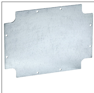
Piastra di fondo per cassette di derivazione Pico viti 1/4 di giro PF 05