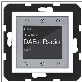
Radio Touch UP DAB+, A.x/C.x, lichtweiß matt