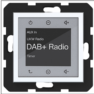
Radio Touch UP DAB+, A.x/C.x, lichtweiß glänzend