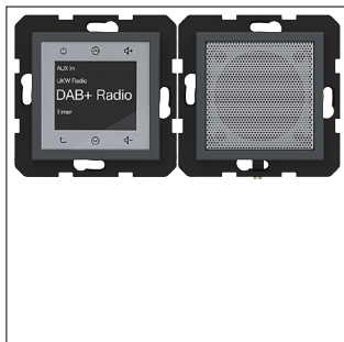
Radio Touch UP DAB+ mit Lautsprecher, A.x/C.x, anthrazit matt, lackiert