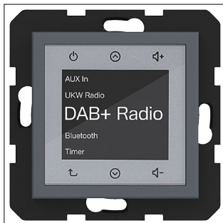
Radio Touch UP DAB+, Bluetooth, A.x/C.x, anthrazit matt, lackiert